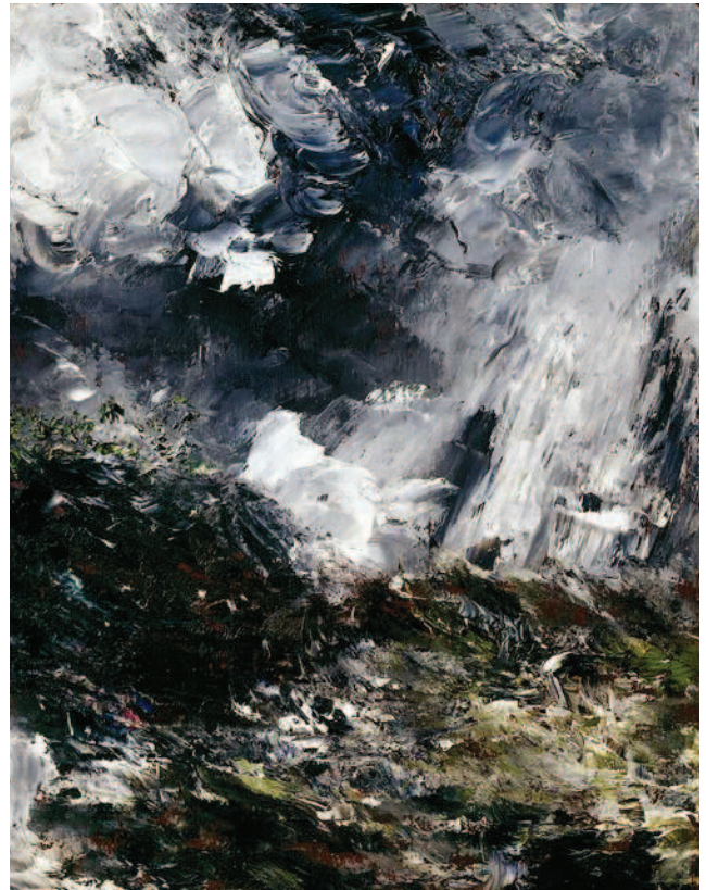
Die Nacht der Eifersucht, 1893 von Strindberg in Berlin gemalt