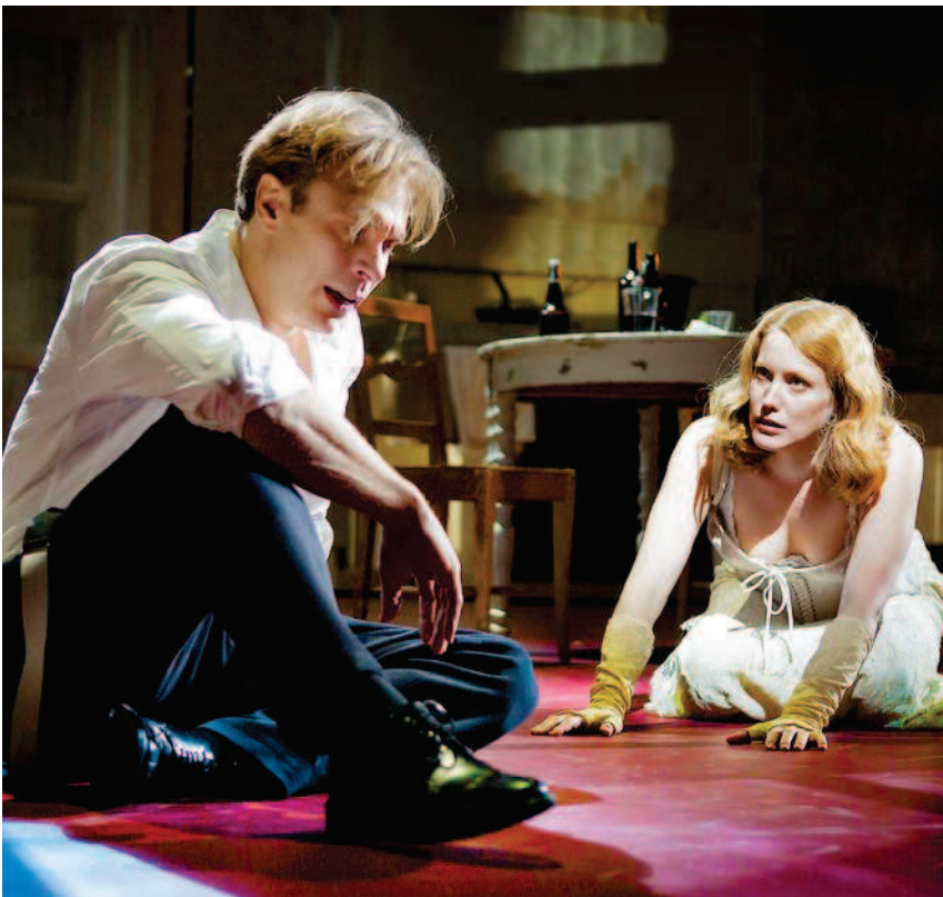
Szene aus Fräulein Julie , das am häufigsten aufgeführte Stück Strindbergs

► der dunkelsten Eheschilderungen Strindbergs; hier wird der Naturalismus mit traumartigen Sequenzen durchsetzt.