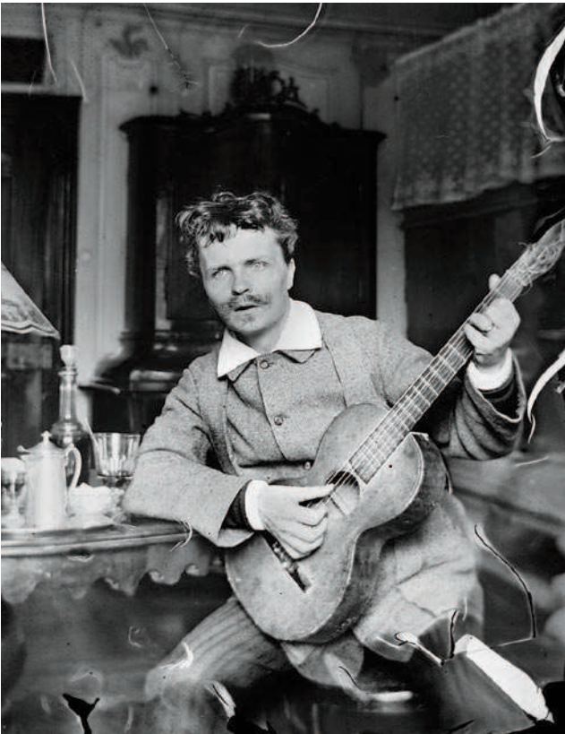
Selbstporträt, 1886 im schweizerischen Gersau aufgenommen